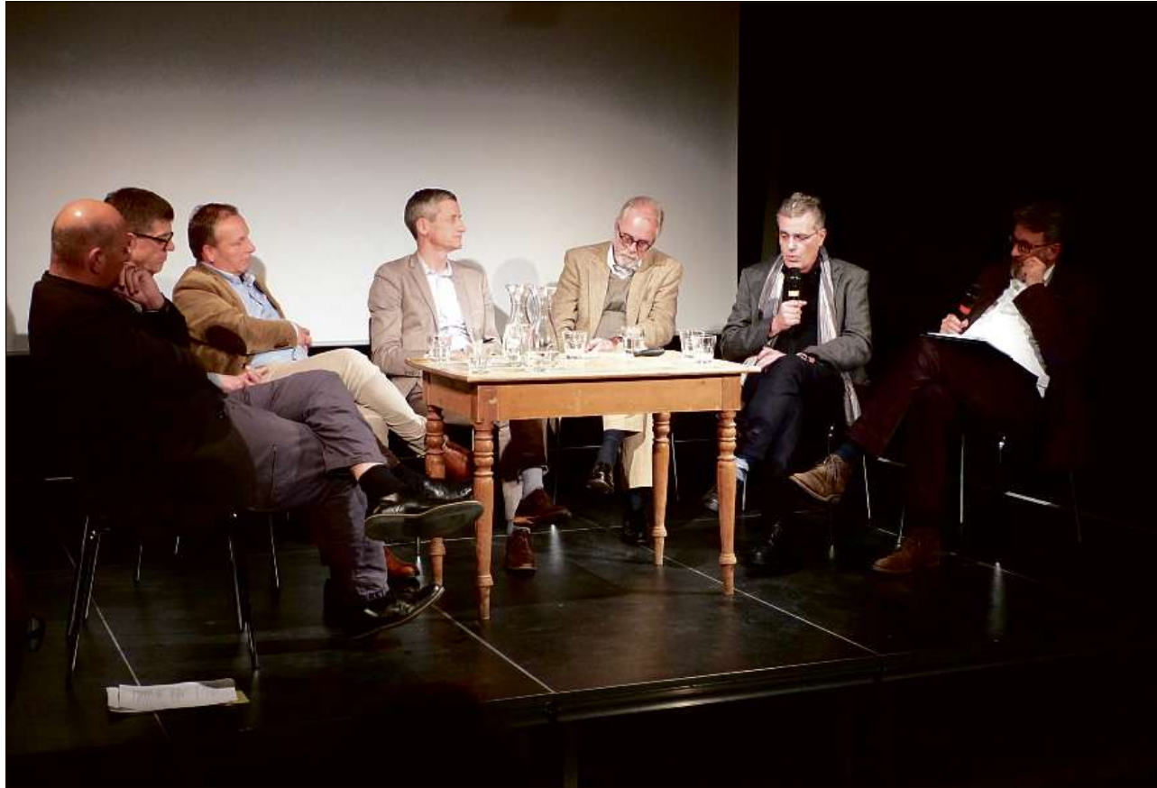
Illa saletta dal Center d'art contemporanea Nairs han discuss moderatuors e giasts davart ils potenzials turistics da la regiun.

L'architect Giuliani ha tgnü il referat input chi ha tematisà la construcziun d'hotels in Engiadina i'ls ons 1860 fin 1914 ed i'ls ons davu las guerras. «A partir da la mità dal 19avel tschientiner culla società liberala han eir ils 'normals' citadins e na plü be la nöblia cumanzà a far vacanzas, our da la cità malsana illa natüra intacta.» Uschea es nat il turissem alpin. Quel premettaiva però differentas infrastructures, «sper las colliaziuns culla viafier dovraiva eir hotels». Il prim as trattaiva dad hotels da cura. Tant a San Murezzan sco eir a Nairs sper Scuol sun gnüts fabricats i'ls ons 1860 gronds hotels da cura. «Quels hotels as rechattaivan in vicinanza da funtanas d'aua minerala, els nu faivan part dal cumün», ha dit il perit, «pür plü tard sun gnüts erets ils hotels in cumün, sco p. ex. a Samedan l'Hotel Bernina.» Ils prüms hotels pella clas-